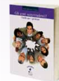
GLI ANNI SORPRENDENTI (Genitori)