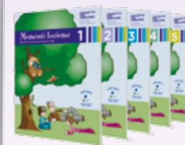
MOMENTI INSIEME (Genitori e Studenti)