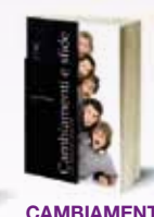
CAMBIAMENTI E SFIDE (Studenti)